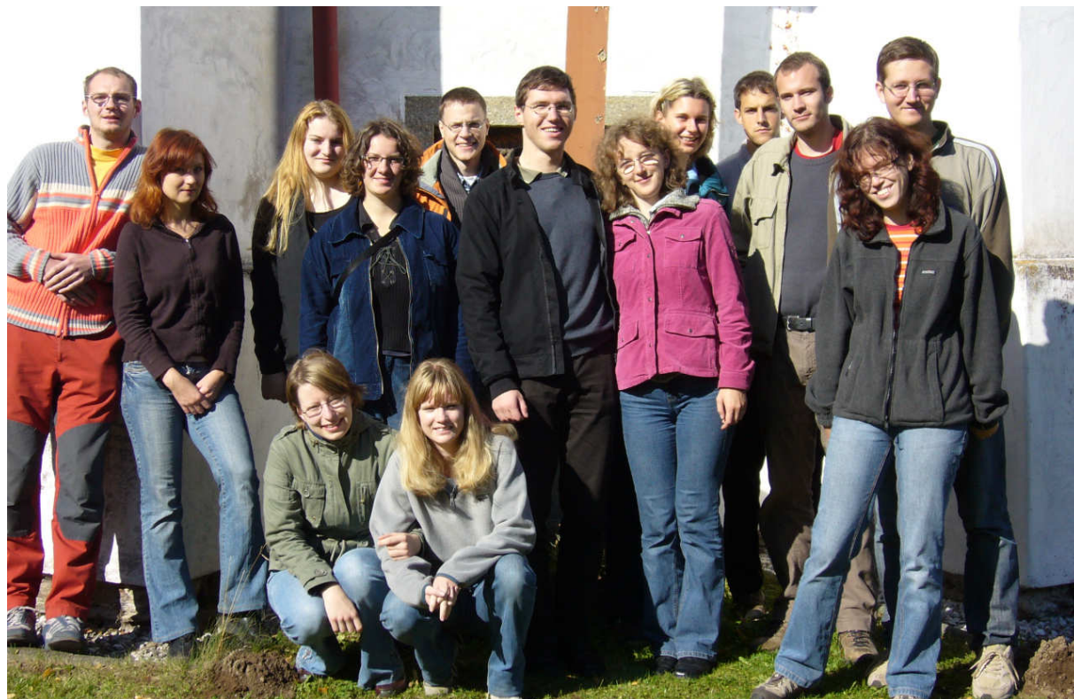
Společné foto účastníků setkání VKH Praha v Dobrušce 27.-30. září 2007: